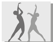
Oficina In Concert

desde o planejamento à execução, o que inclui realização de inscrições, definição e convite dos palestrantes, divulgação interna, recepção dos convidados, ambientação das salas, instalações artísticas, entre outros. O evento tem, ainda, a importante função de melhor instrumentalizar as turmas em relação aos seus subtemas, para que tenham acesso a novas informações e referências que serão fundamentais na elaboração e fundamentação das apresentações artísticas do Oficina in Concert.