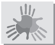
Conselho de Representantes

Conselho de representantes | O Conselho de Representantes é um fórum que reúne representantes de todas as turmas em tornos de discussões e questionamentos envolvendo a rotina escolar. O Conselho se reúne ordinária e extraordinariamente para tratar e deliberar sobre questões disciplinares e comportamentais, sob a responsabilidade dos Orientadores Pedagógicos, construindo e garantindo o Pacto de Convivência entre membros da comunidade escolar. Neste espaço o(a) aluno(a) tem a oportunidade de desenvolver sua participação organizada na sociedade. Além disso, funciona como órgão fiscalizador e de apoio às atividades do Grêmio. Entende-se, assim, que o(a) aluno(a) tem a oportunidade, por intermédio desse projeto, após a convivência familiar, iniciar, desenvolver e exercer sua participação organizada na sociedade. Assim, o Conselho de Representantes consubstancia-se em fórum legal de estudos, discussões e questionamentos, no qual se exercita o respeito ao espaço alheio, o aprendizado da tolerância, da escuta, da fala, das diferenças individuais e coletivas.