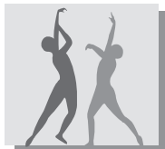
Oficina In Concert

O Oficina in Concert é a grande aula pública do Colégio Oficina, momento em que alunos(as) de todas as séries e turmas sobem ao palco para apresentar, através das mais variadas linguagens artísticas, os resultados de um ano inteiro de pesquisas, aprendizados e dedicação tendo como mote o Tema do Ano. Mas o trabalho não se resume ao palco. Há todo um processo anterior que envolve, por exemplo, a escolha e capacitação das lideranças de turmas, amplas pesquisas sobre o tema, o desenvolvimento de habilidades para trabalhar em grupo, definição dos papéis de cada aluno(a) e a organização de um Congresso – o CONESCO – em que convidados palestram sobre os subtemas de cada turma ajudando-os na construção de referenciais para a concepção do espetáculo. Além, é claro, da realização de workshops de roteiro, figurino, iluminação, trilha sonora e maquiagem, entre outros.